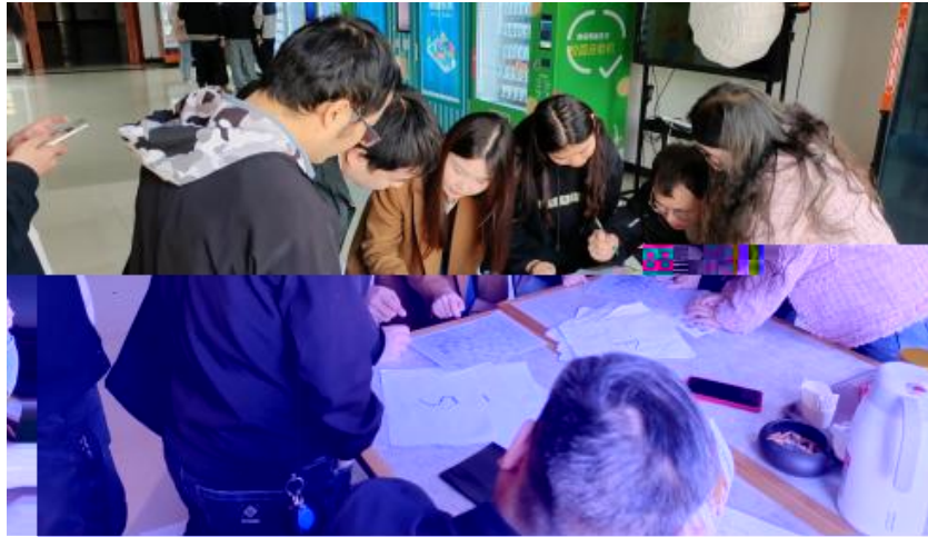
图 卓越团队建设共识营